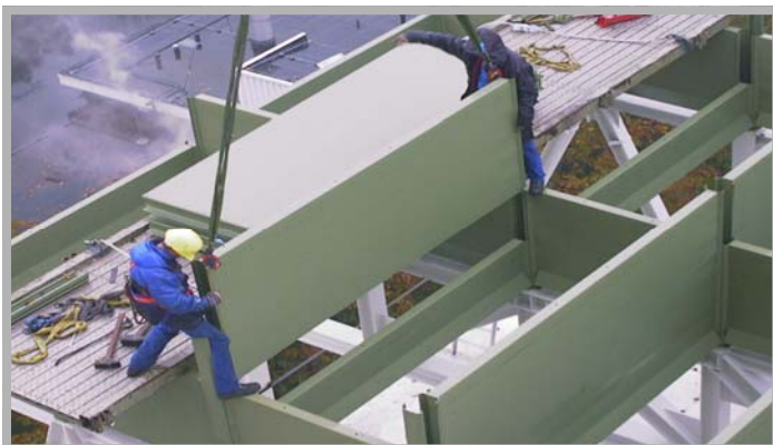
Teljesen sík falú, csavarmentes tartálycsoport szerelése.