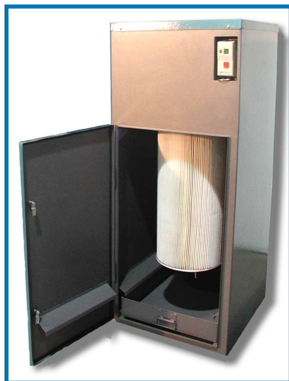
Instalații de filtrare cu cartușe tip APSZ-01

Regimul de curățire este reglabil pe cale electronică.