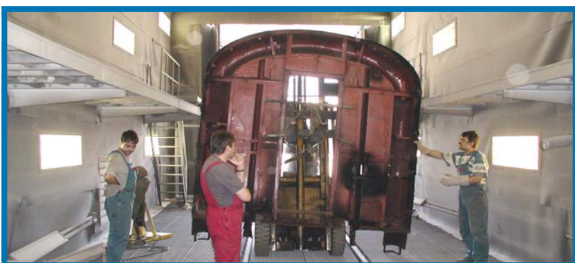
Bombardier Transportation MÁV Hungary Kft. - Dunakeszi