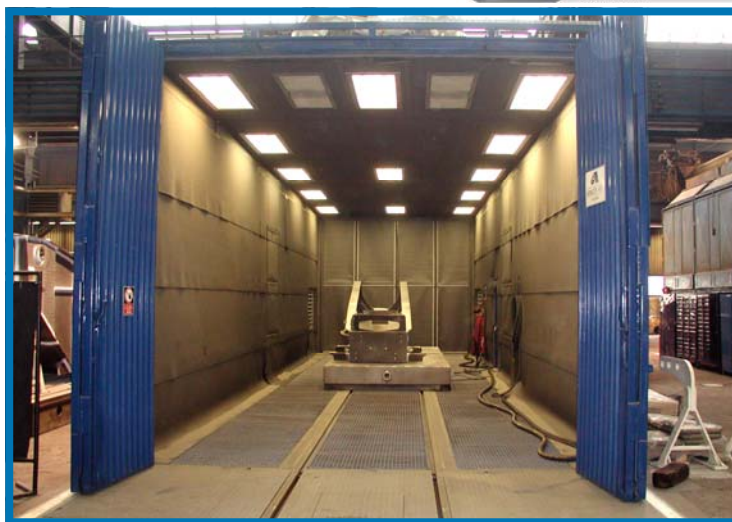
DEMAG Mobile Cranes Gépgyártó Kft. PÉCS — Szóróterem, beltéri kivitel