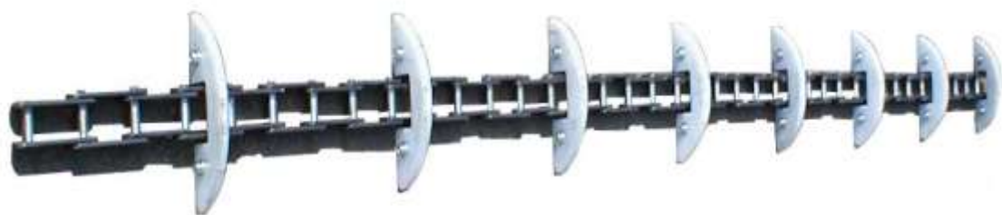
Szárnyasrédler lánc kaparóelemekkel